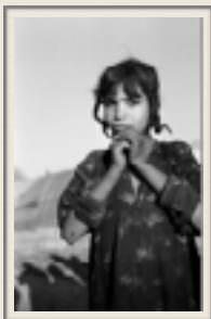
Chica Suaid (Marsh Arabs), Iraq - W. Thesiger

Sir Wilfred Patrick Thesiger (Addis Ababa el 3 de junio de 1910 - 24 de agosto de 2003), fue un explorador inglés y escritor de viajes. Los libros de viajes de Thesiger incluyen Arenas de Arabia (1959) que recoge sus viajes en el "Territorio vacío" del Desierto de Arabia entre 1945 y 1950 donde describe el desvaneciente mundo de los beduinos. En Los árabes de las marismas (1964) describe los pueblos que vivieron en las marismas del sur de Irak. Un enérgico aventurero, escritor y aclamado fotógrafo donó su colección de 38,000 fotografías al Pitt Rivers Museum, Oxford, desde donde se compraron estas para la colección Califa.