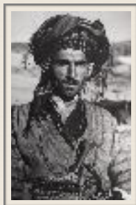
Pizdhar tribesman, Kurdistan - W. Thesiger