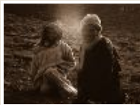
Bwgmez tribesman, M'Goun, Maroc. James Stuart 1993