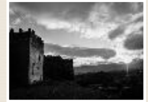
Glaoui Fortress, Telouet, Maroc. James Stuart 2015