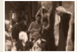
James Madina Souk, Aleppo Syria. Charles Stuart 1973