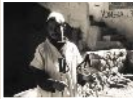
Imlil, High Atlas, Morocco James Stuart 1990