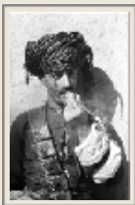
Pizdhar tribesman, Kurdistan - W. Thesiger