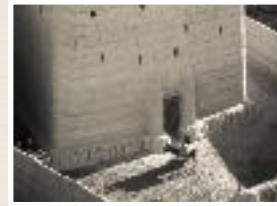
Silo de grano, Sana'a, Yemen Charles Stuart 1975