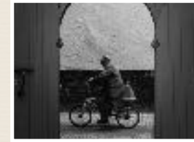
Hombre en bici, Essaouira, Maroc. James Stuart 2016