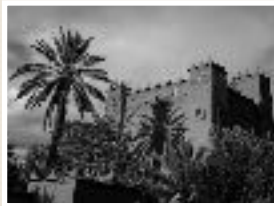
Skoura oasis, southern Atlas, Maroc. James Stuart 2015