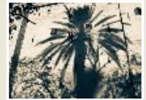
Skoura oasis, southern Atlas, Maroc. James Stuart 2015