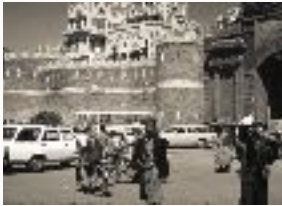
Hombre y cuchillo, Sana'a, Yemen. Charles Stuart 1976