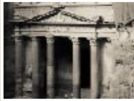
Nabatean temple, Petra, Jordan. Charles Stuart 1972