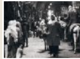
Al-Madina Souk, Aleppo, Syria. Charles Stuart 1973