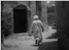
Najran, Saudi Arabia Charles Stuart 1976