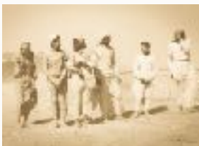
Tormenta de arena, Hadramout. C. Stuart 1976