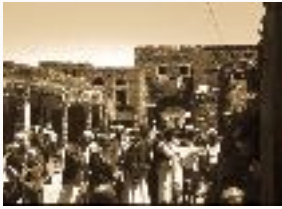
Hamir market, Yemen. Charles Stuart 1976