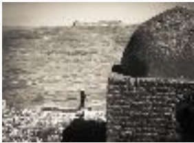
Vista desde Hamir, Yemen Charles Stuart 1975