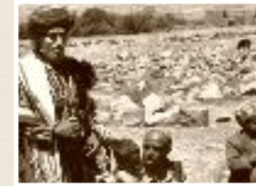
Hamir tribesman, Yemen. Charles Stuart 1975